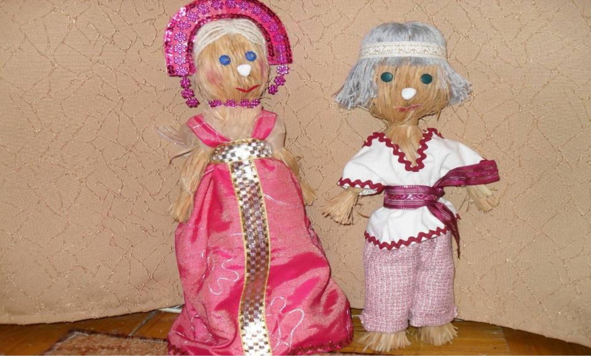
Хворајка и Неболейка