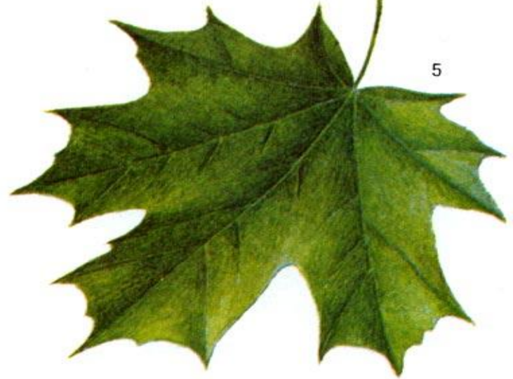
Клен остролистный: 1 — общий вид осенью; 2 — безлиственный побег; 3 — цветущий побег; 4 — крылатый плод; 5 — лист.