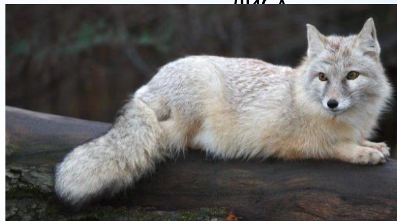
КОРСАК - СТЕПНАЯ ЛИСА