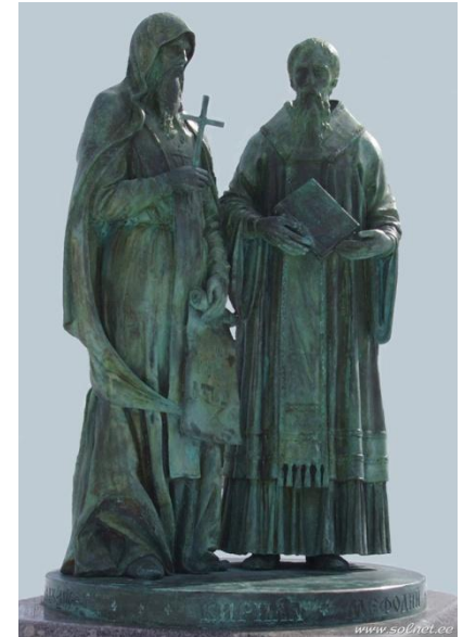
Памятник Кириллу и Мефодию (г.Дмитров, Московская Область)