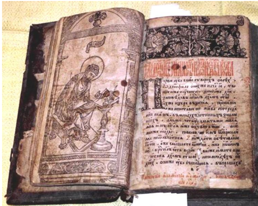
Первая российская печатная книга "Апостол" (1564 г.).