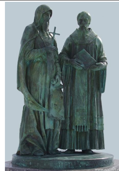
Памятник Кириллу и Мефодию (г.Дмитров, Московская Область)