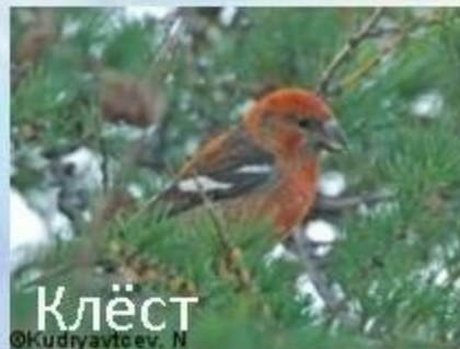
Клёст © Кудрявцев. N