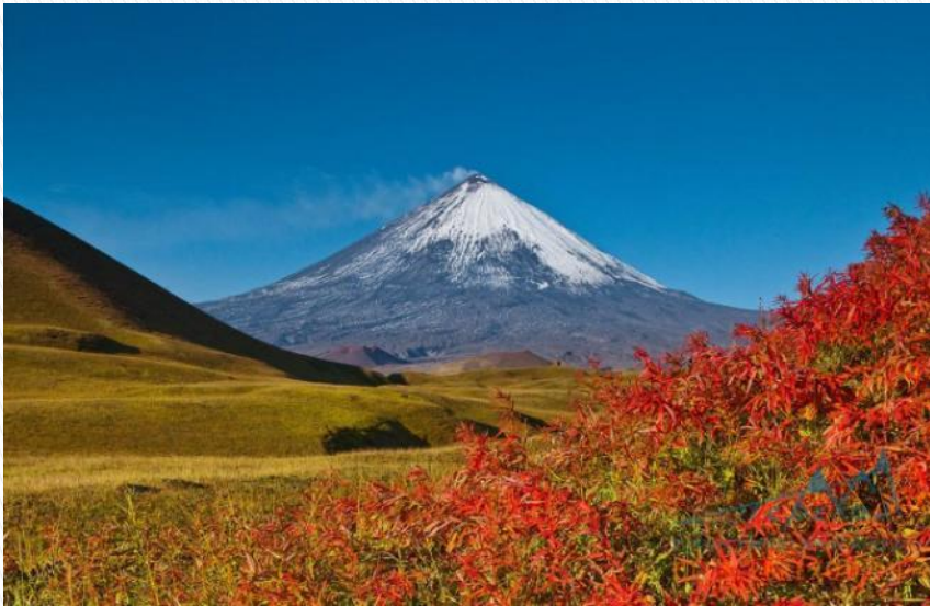
Вулкан на Камчатке

Вулканы, извергающиеся регулярно, называются действующими. Если действия вулкана прекратились, его называют потухшим. В нашей стране много действующих вулканов на Камчатке и Курильских островах.