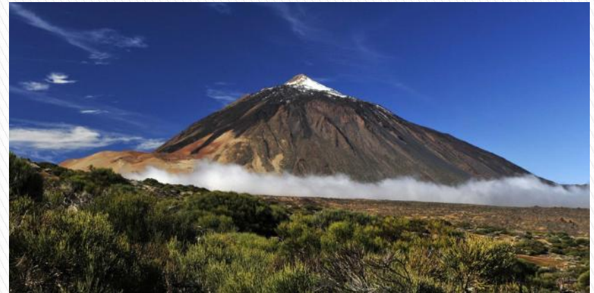
Вулкан на Канарских островах