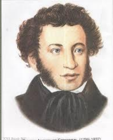
Пушкин Александр Сергеевич (1799-1837)

Писатель – тот, кто придумал книгу, написал ее.