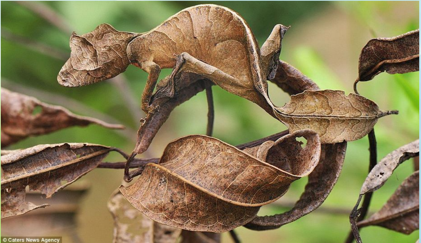
Листохвостый или сатанинский геккон (ящерица).