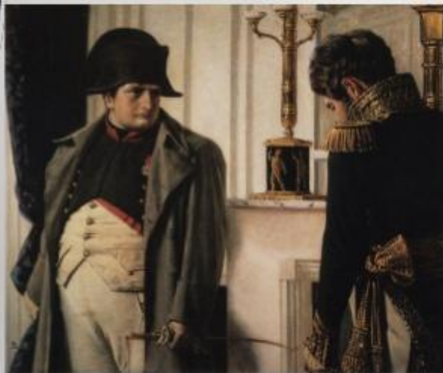
Наполеон и Лористон. "Мне нужен мир, во чтобы то ни стало"

«Я прошу вас при этом написать императору Александру, которого я уважаю по-прежнему, что я хочу мира».