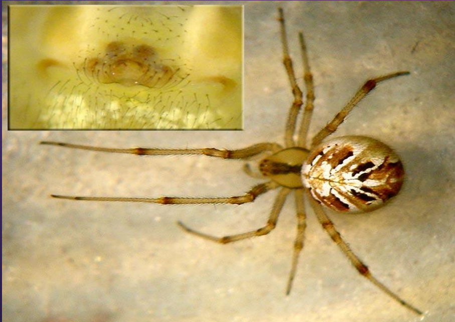
- Phylloneta impressa