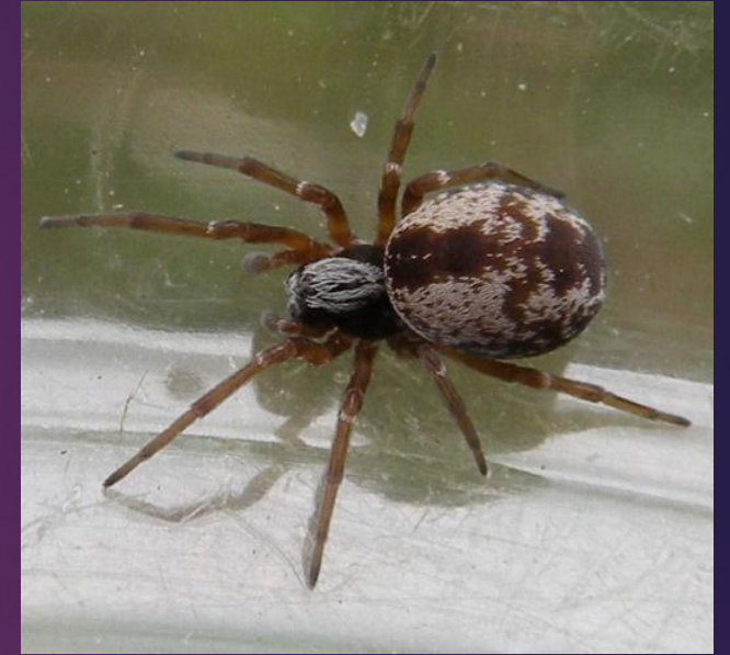
Dictyna arundinacea -