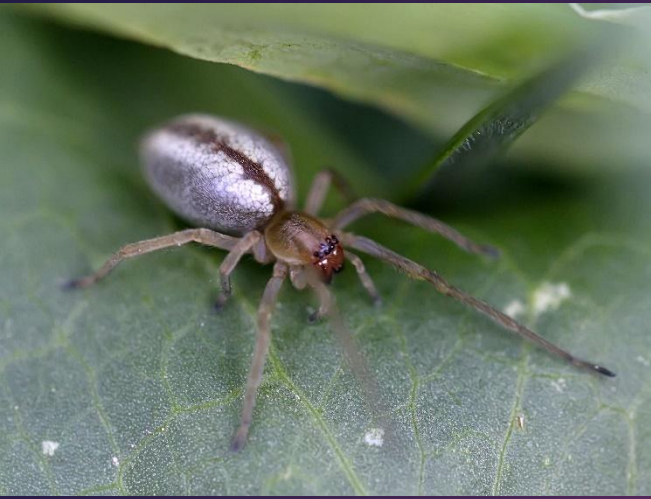
- Cheiracanthium erraticum