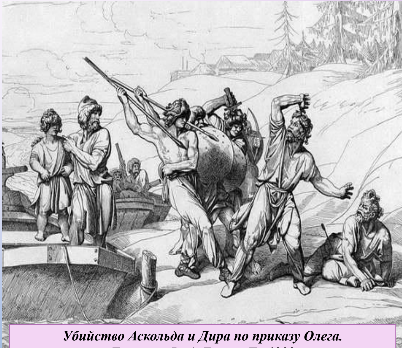
Убийство Аскольда и Дира по приказу Олега. Гравюра Ф. А. Бруни. До 1839

В то время в Киеве правили Аскольд и Дир , не принадлежащие к княжескому роду. Олег выманил хитростью их из города и отдал приказ их убить. После этого киевляне сдались без боя, Олег занял место великого киевского князя, а сам город провозгласил «матерью городов русских».