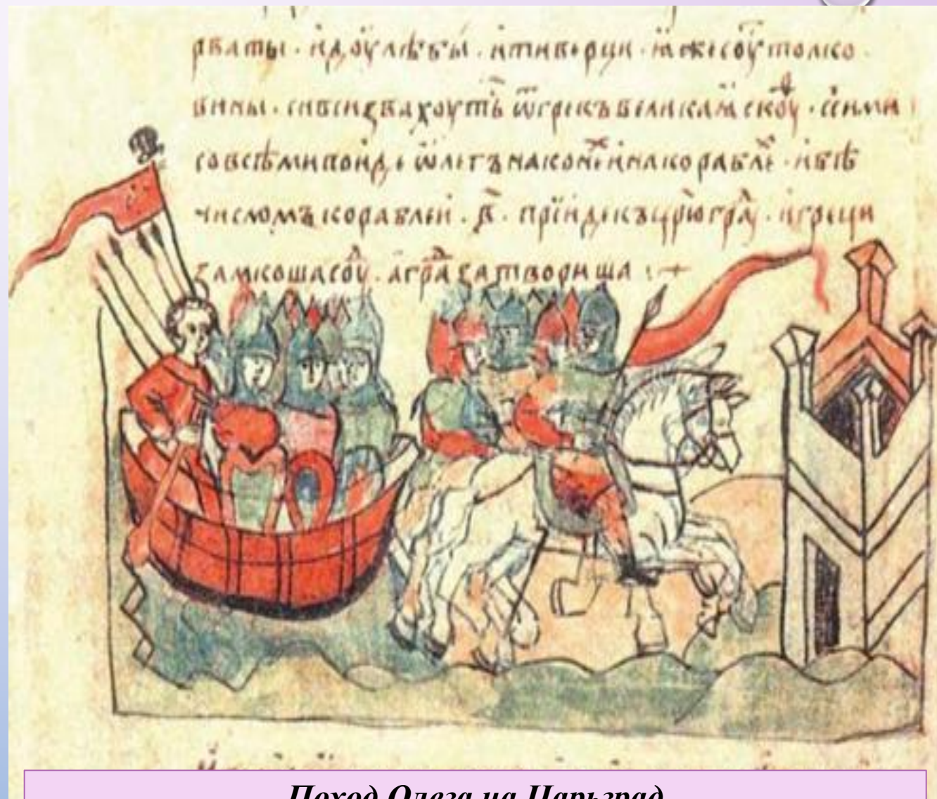
Поход Олега на Царьград Миниатюра Радзивилловской летописи

Правление князя Олега в Киеве началось с укрепления городских стен и защитных сооружений. Границы Киевской Руси, так же, укреплялись небольшими крепостями «заставами», где несли постоянную службу дружинники. Князь в 883 – 885 гг. предпринял несколько успешных походов.