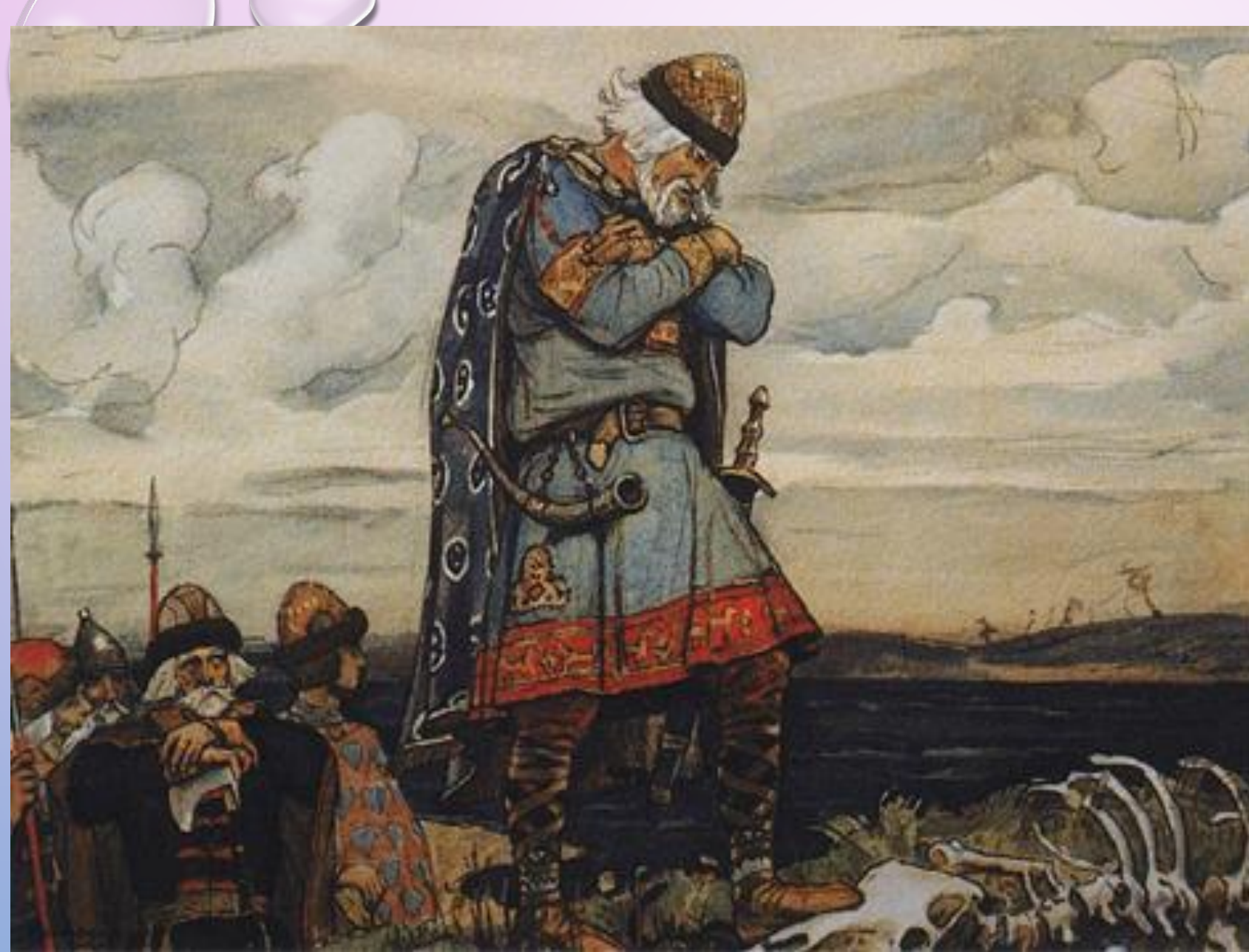
Князь Олег у костей коня. Картина В. Васнецова, 1899

Олег, по версии Первой Новгородской летописи, находит свой конец, когда уходит из Киева на север в Ладогу, где его поджидает легендарная змея. Укушенный ею, он умирает, но не в 912 г., а в 922 г. Сообщает Новгородская летопись и еще одну версию гибели Олег: некоторые говорят, что Олег ушел «за море» и там умер.