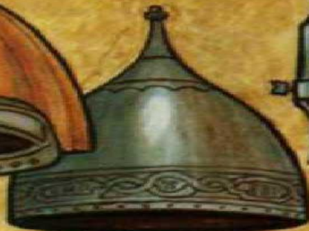
Шишак XV в.