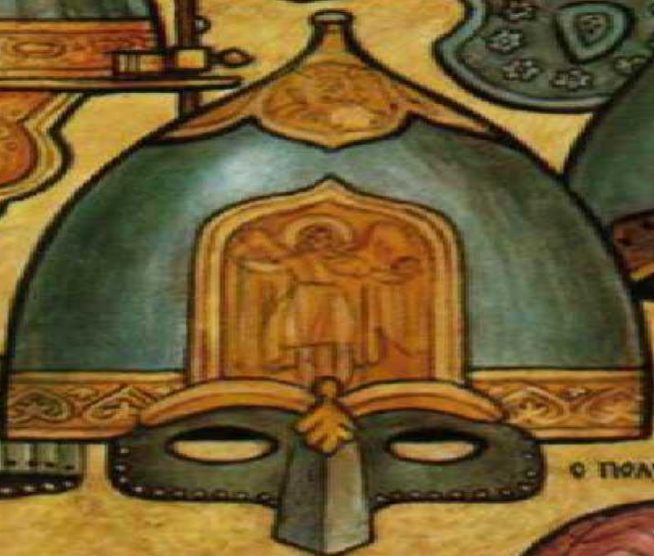
Шлема с полумаской XII в.