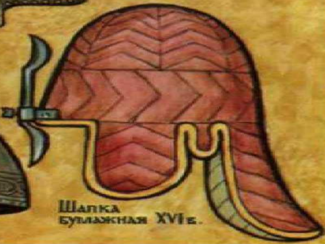
Шапка булажная XVI в.