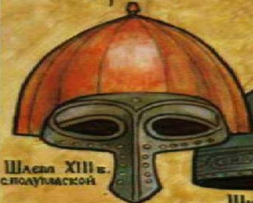
Шлема XIII в. с полумаской