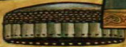
Мисюрка XV в.