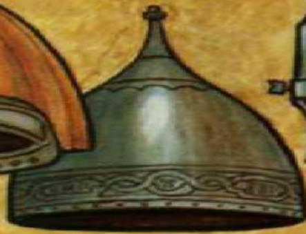
Шишак XV в.