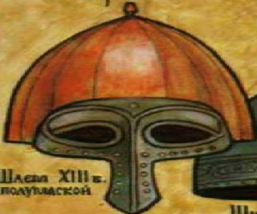
Шлема XIII в. с полумаской