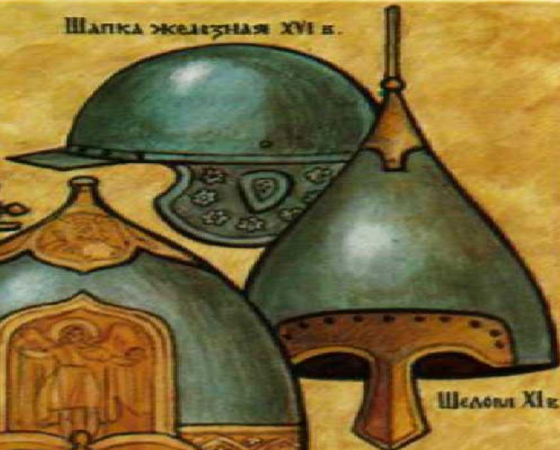
Шлема XI в.