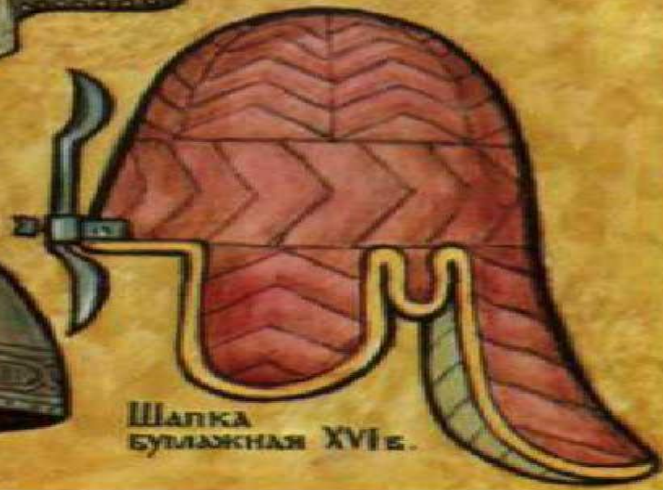
Шапка булажная XVI в.