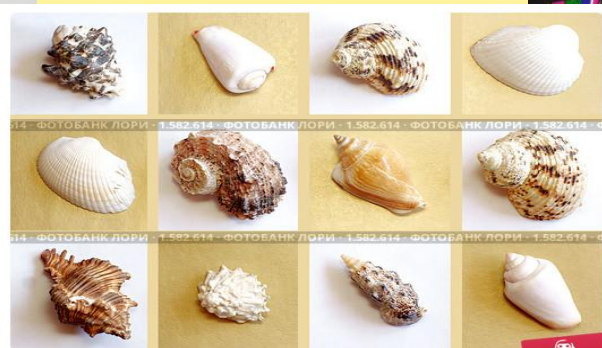
Коллекция ракушек