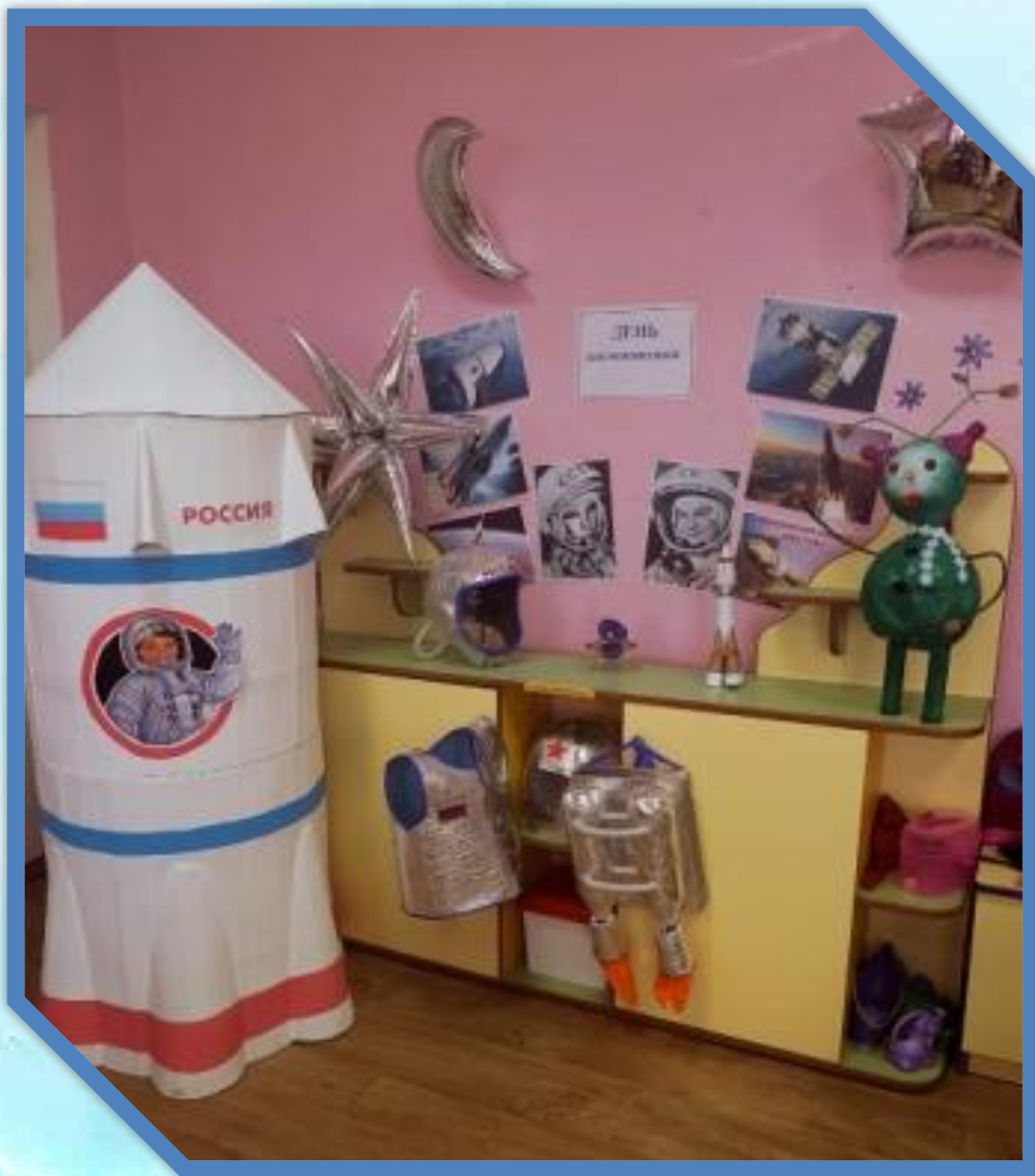
Тематический уголок в средней группе