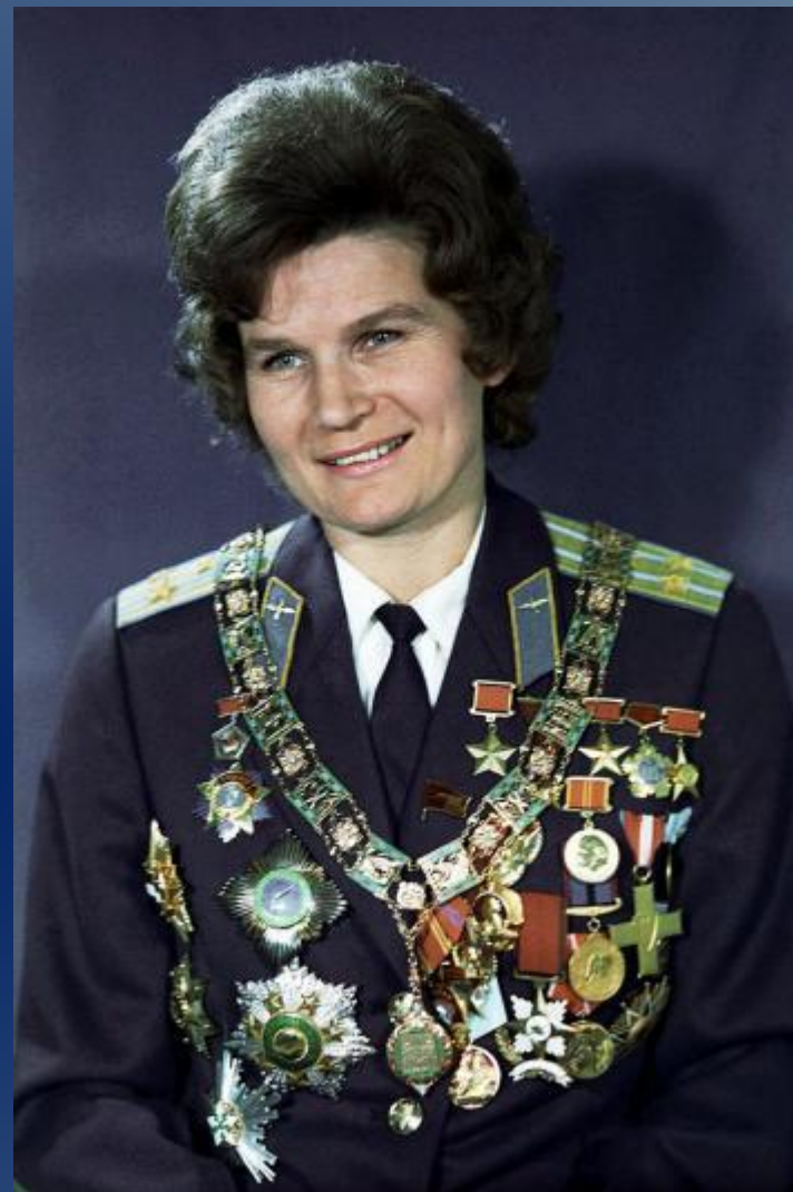
Валентина Владимировна Терешкова