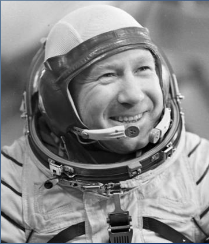
Леонов Алексей Архипович