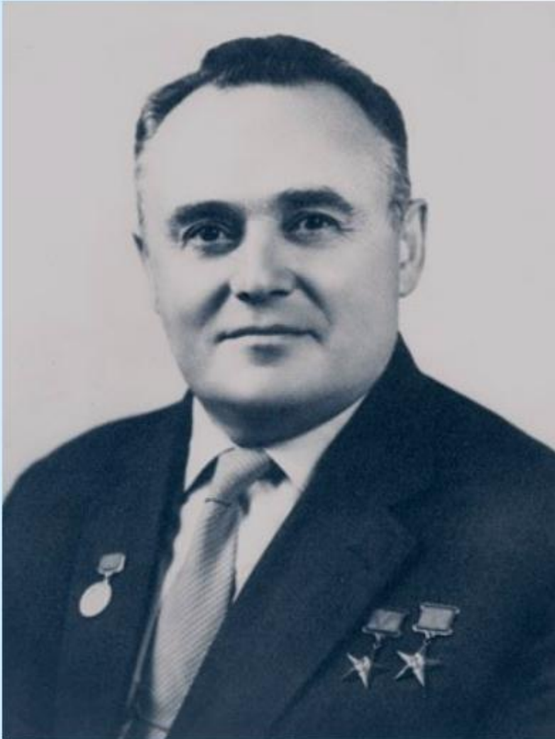
Сергей Павлович Королев (1907-1966)