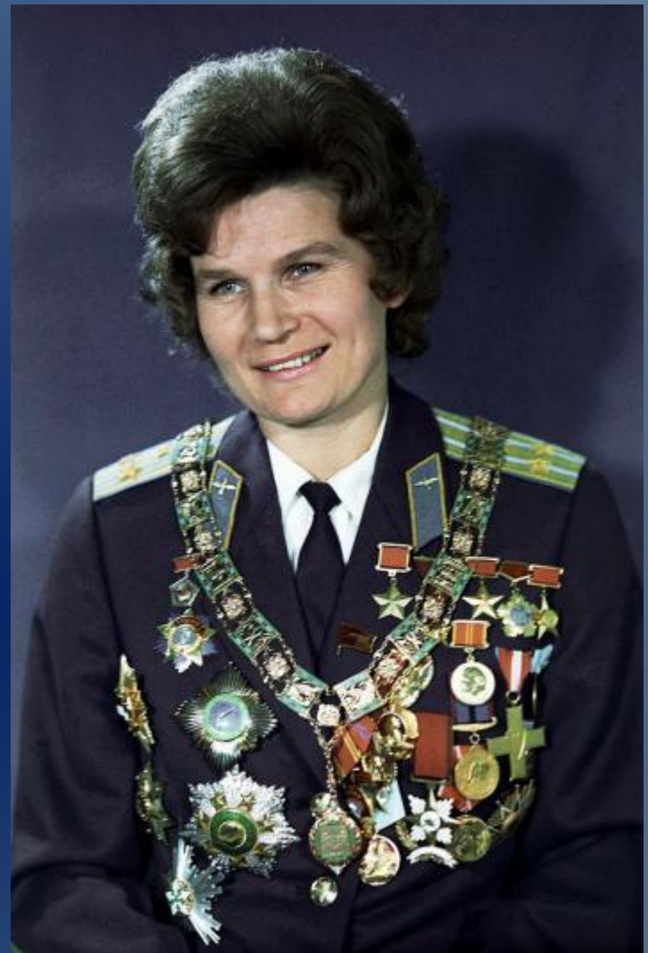
Валентина Владимировна Терешкова