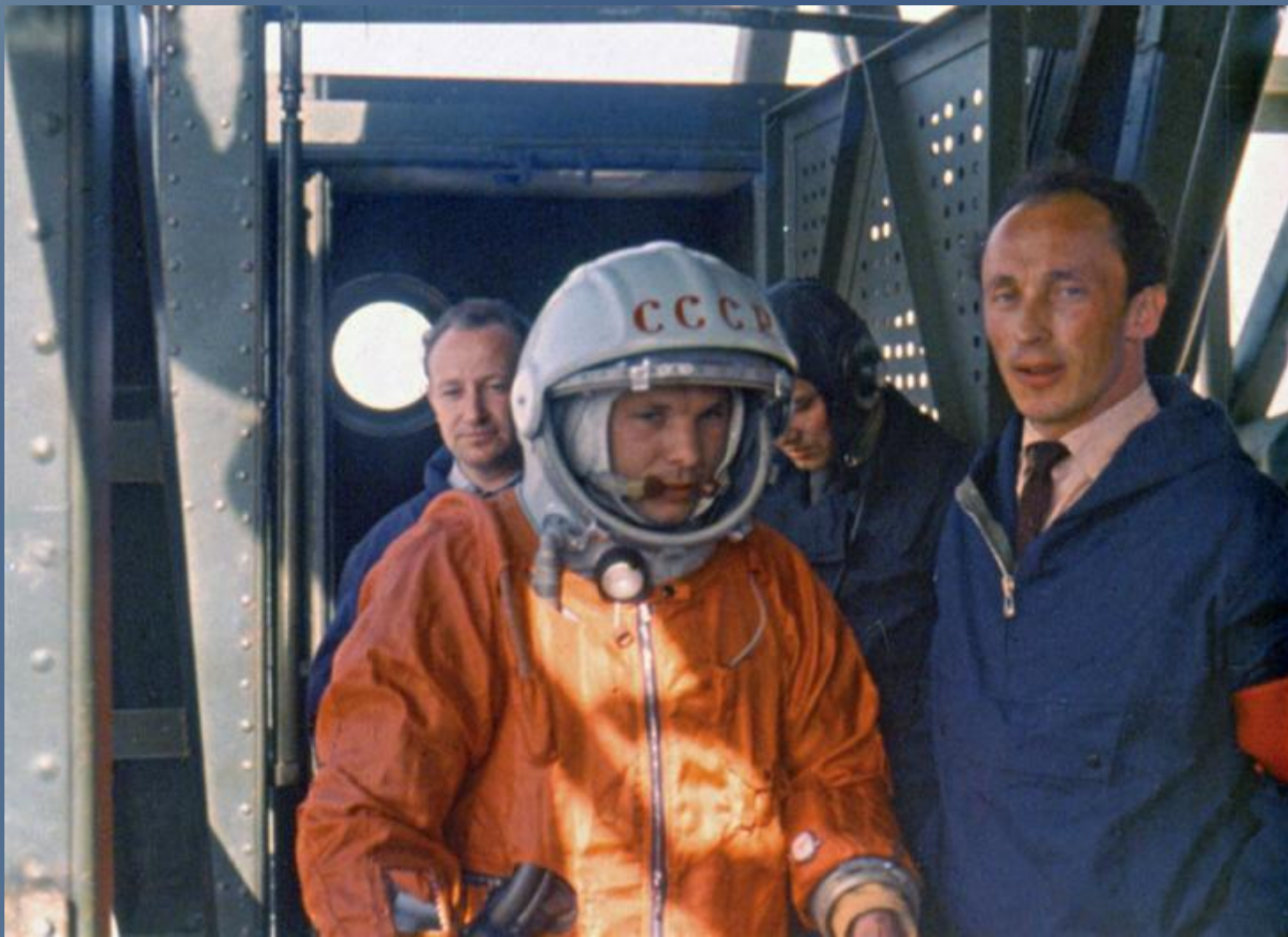
Гагарин Юрий Алексеевич