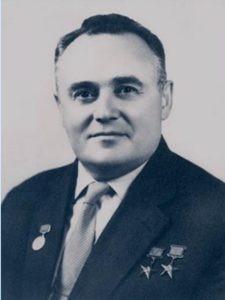
Сергей Павлович Королев (1907-1966)