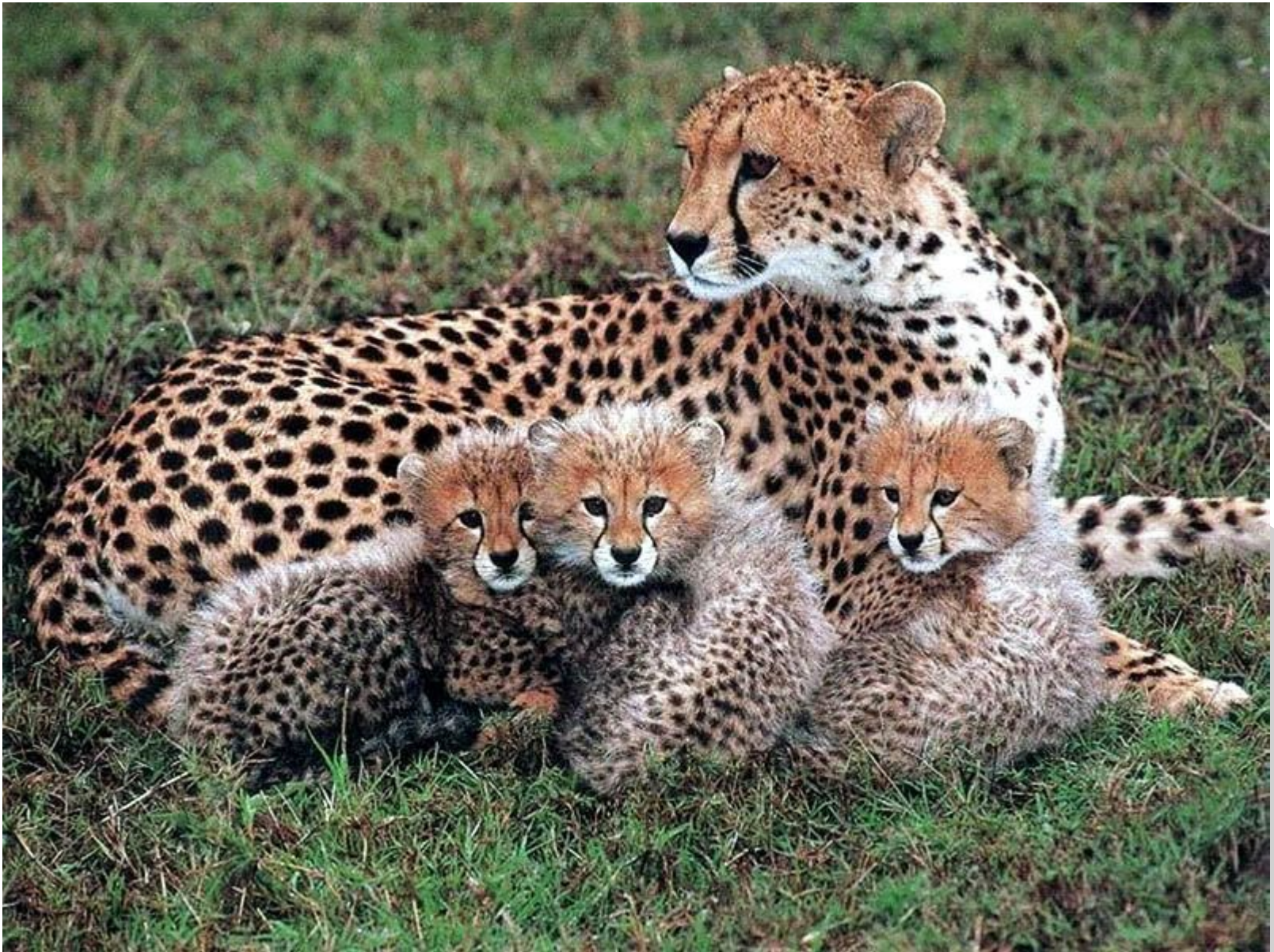
Гепард ( Acinonyx jubatus ) — охраняемый вид, занесенный в Международную Красную книгу.