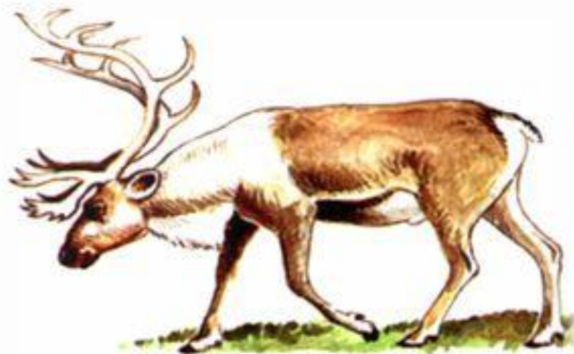
Северный олень (лесной подви́д)