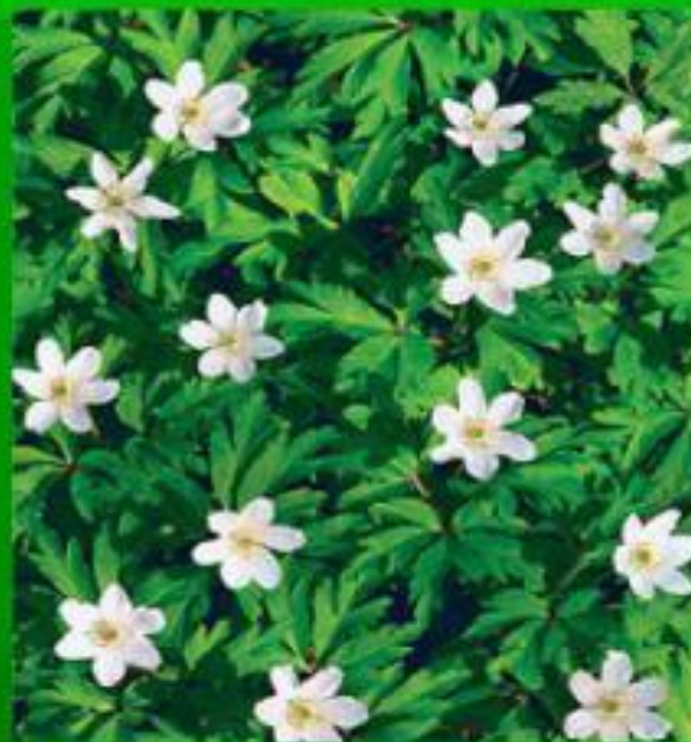
Ветреница дубравная - 3 категория – редкий вид по Красной книге Московской области