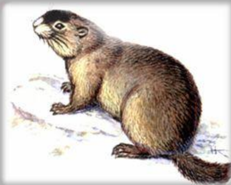
Прибайкальский черношапочный сурок