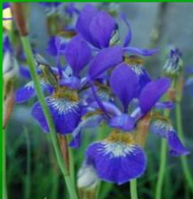
Ирис сибирский - 3 категория – редкий вид по Красной книге Московской области