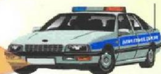
Милиция – 02