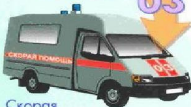
Скорая помощь – 03