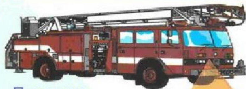
Пожарная охрана – 01