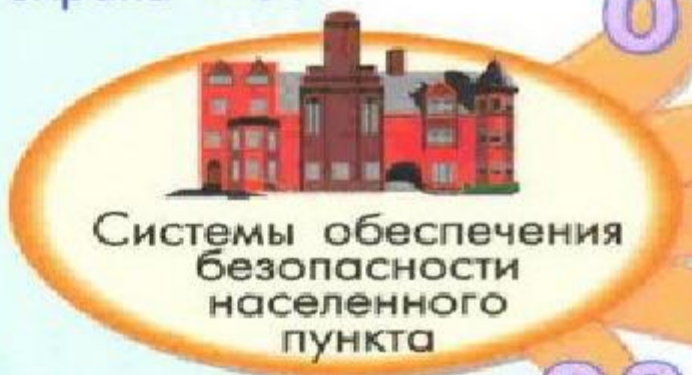
Системы обеспечения безопасности населенного пункта