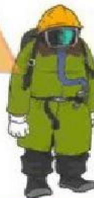
Служба газа 04