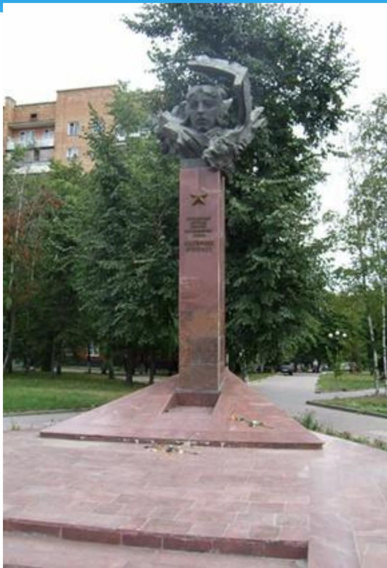
Известной лётчице Кате Зеленко – герою ВОВ