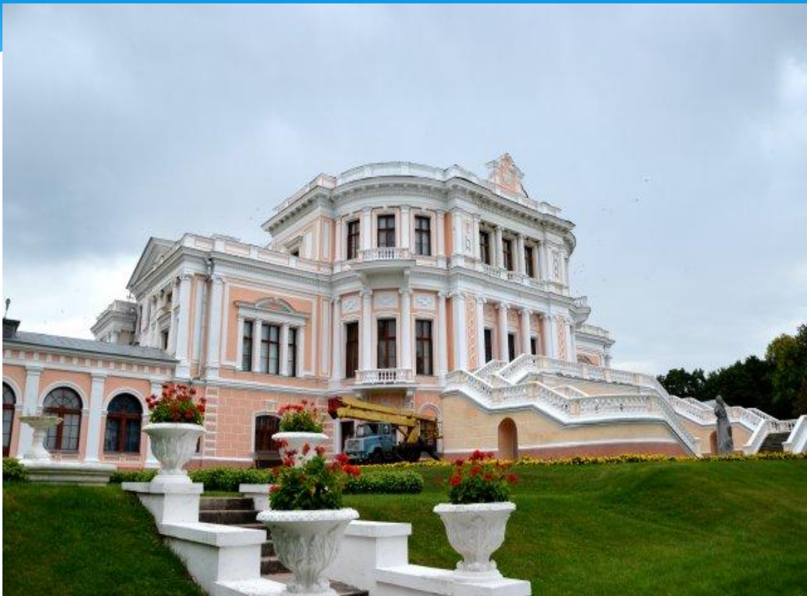
Усадьба князей Барятинских "Марьино»