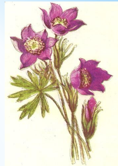
Сон - трава