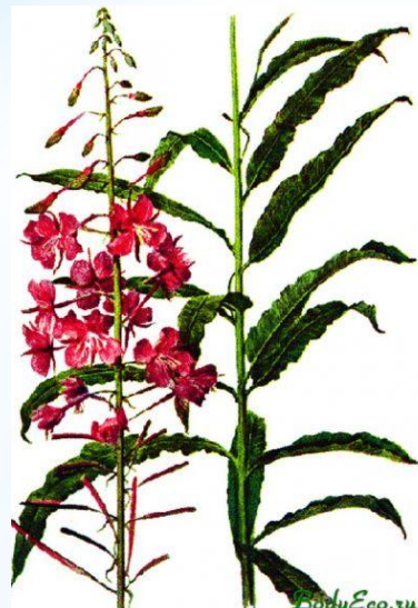
Иван - чай