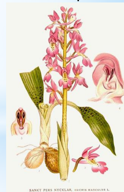
ятрышник мясо - красный