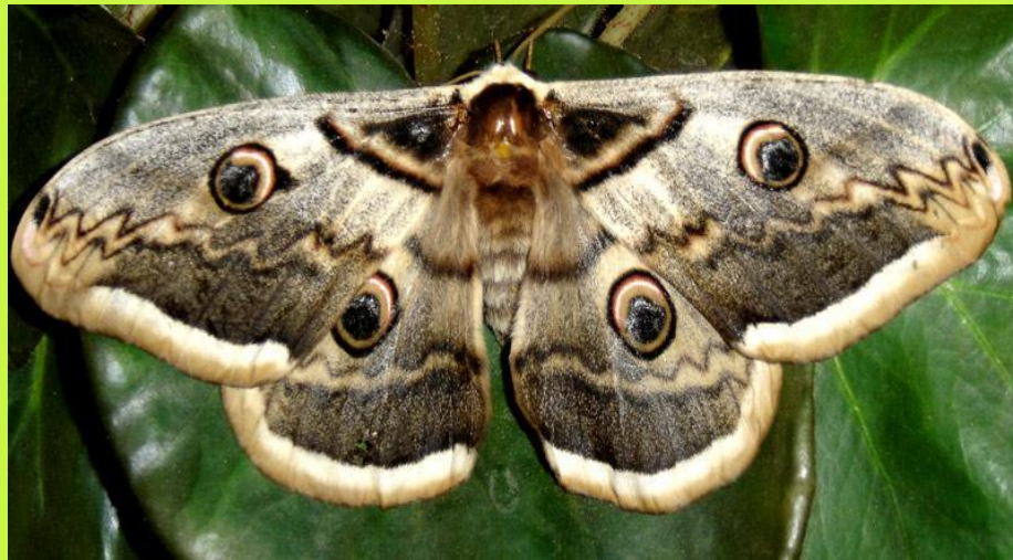
Ночной Павлиний глаз