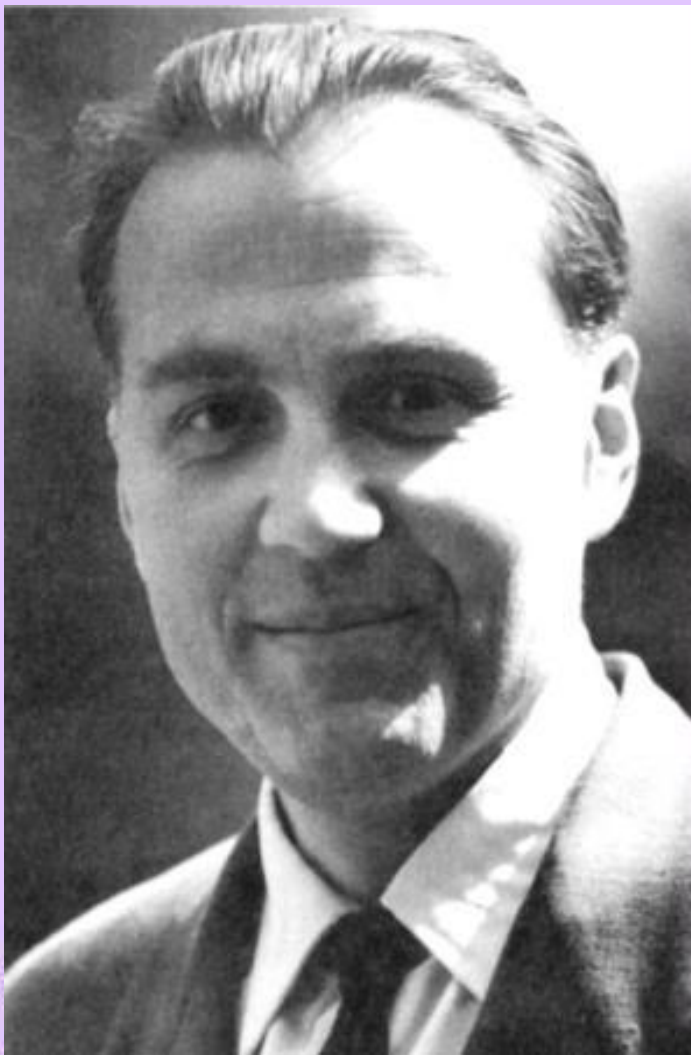
В. А. Сухомлинский

«Умейте открыть перед ребенком в окружающем мире что – то одно, но открыть так, чтобы кусочек жизни заиграл перед детьми всеми красками радуги. Оставляйте что – то недосказанное, чтобы ребенку захотелось еще и еще раз возвратиться к тому, что он узнал»