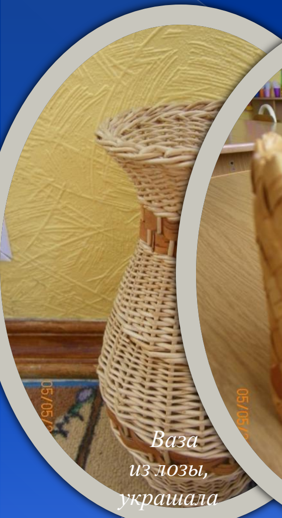
Ваза из лозы, украшала домашний интерьер .