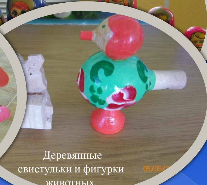
Деревянные свистульки и фигурки животных.