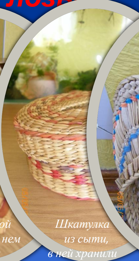
Шкатулка из сыти, в ней хранили мелкие детали нитки, иголки