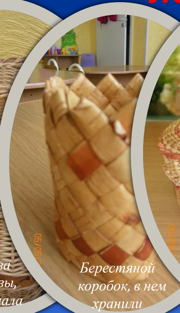
Берестяной коробок, в нем хранили продукты питания.