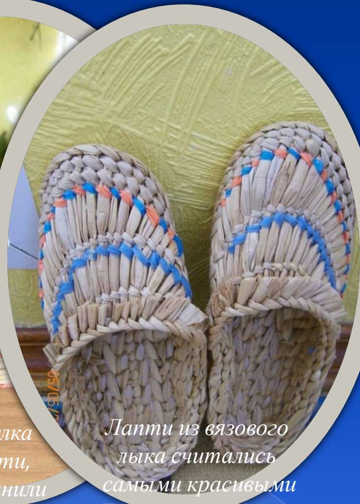
Лапти из вязового лыка считались самыми красивыми Девушки их надевали по праздникам.