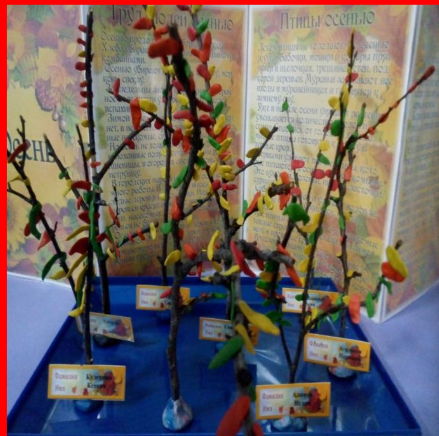
Использование природного материала