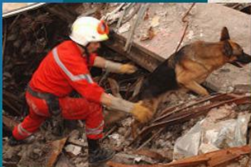
Спасатель с немецкой овчаркой ищет людей