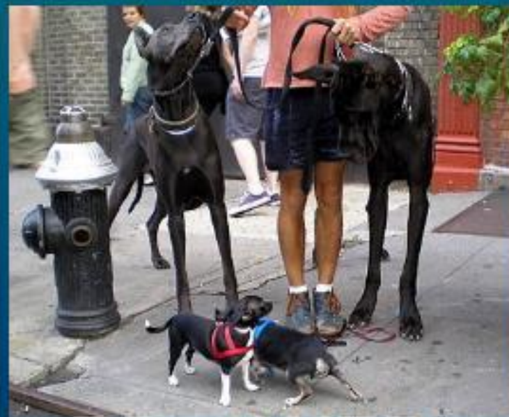
Чихуахуа и доги