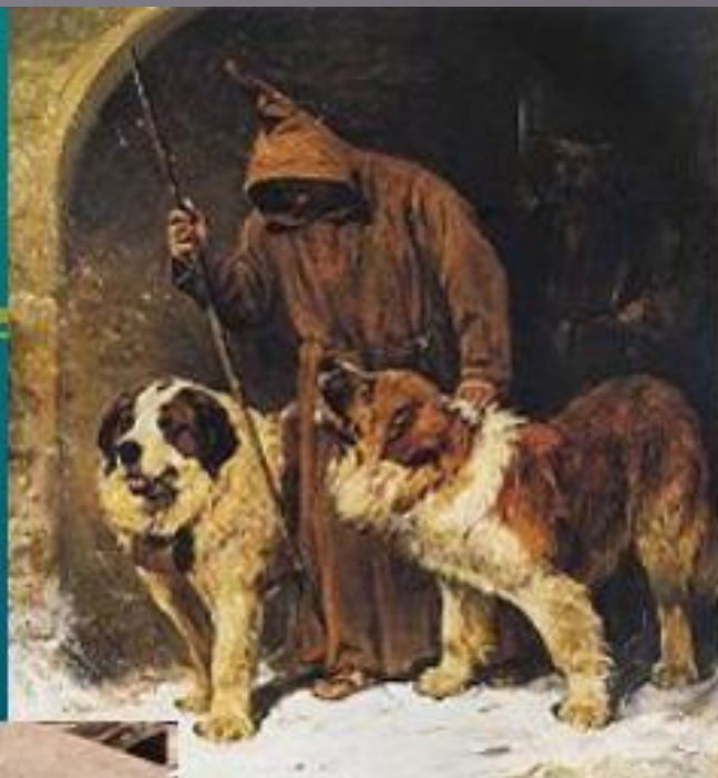
Монах монастыря Сен-Бернар с собаками