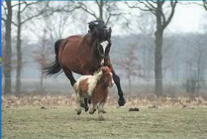
Лошадь и пони