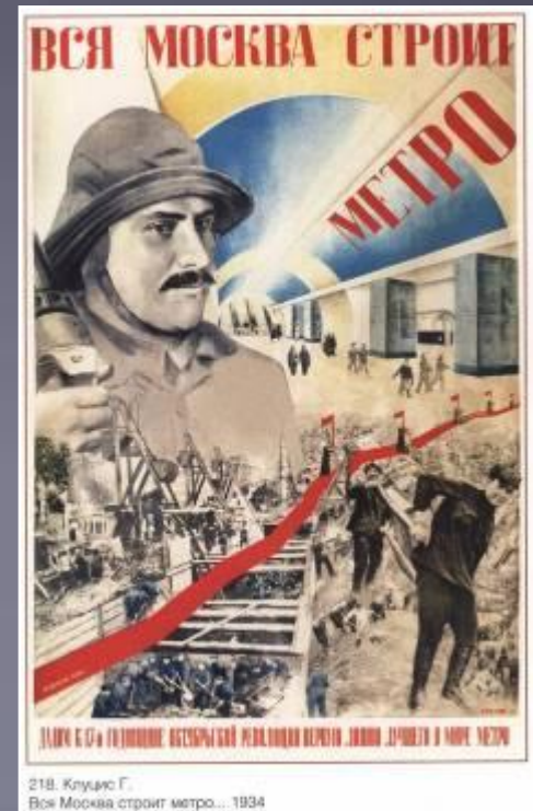
218. Клуцис Г. Вся Москва строит метро... 1934