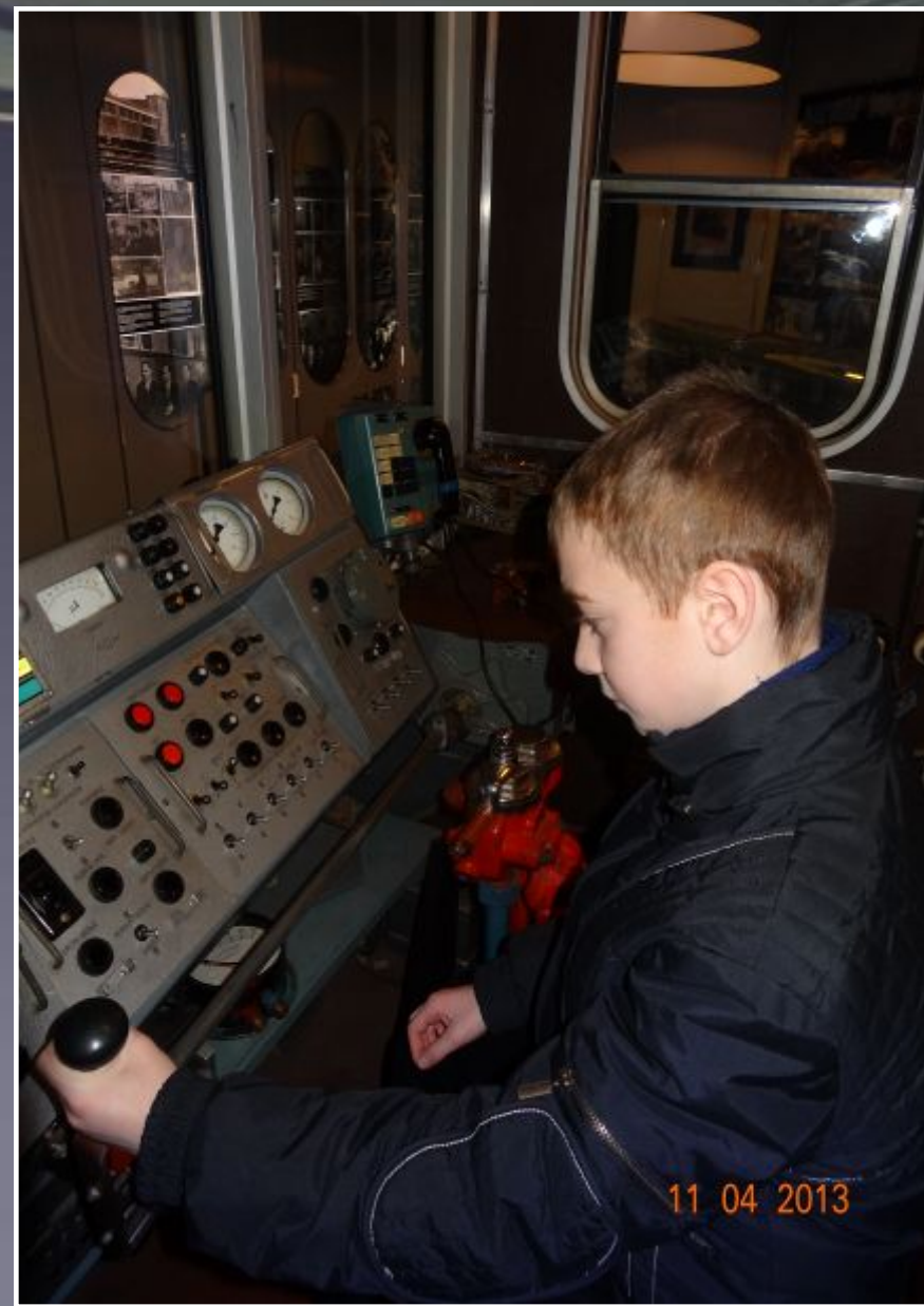
В КАБИНЕ МАШИНИСТА