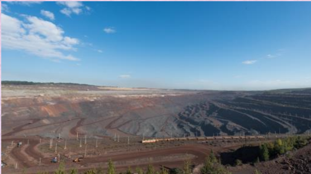
Карьер Михайловского ГОКа

Рождение Железногорска связано с открытием в 1950 году и освоением Михайловского железорудного месторождения знаменитой Курской магнитной аномалии. О его наличии стало известно еще в XVIII столетии, вторичное открытие было в XIX веке. Михайловское железорудное месторождение КМА считается крупнейшим в России, представляя собой мощную рудную полосу шириной 2,5 км и протяженностью 7 км.