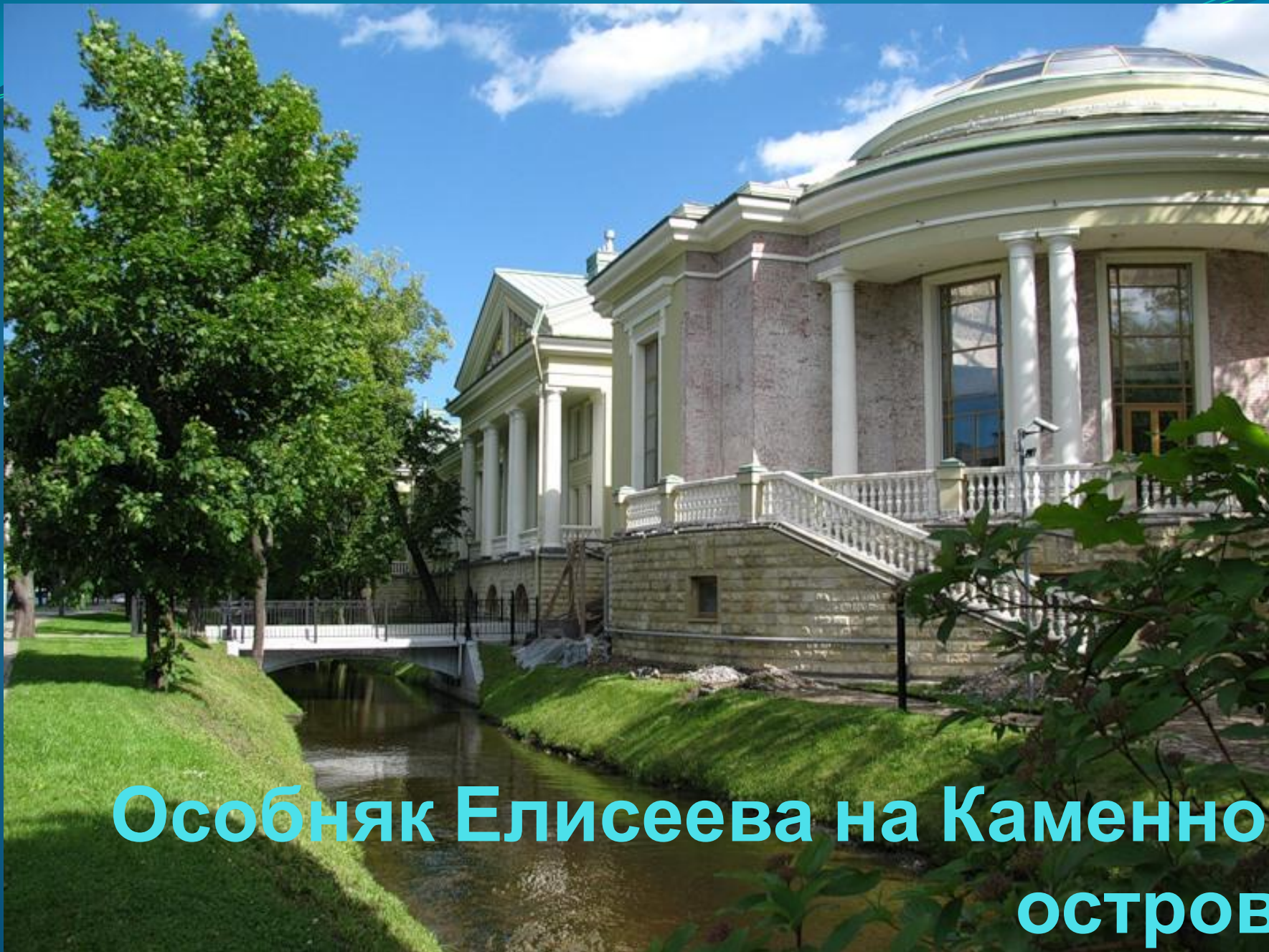
Особняк Елисеева на Каменном острове