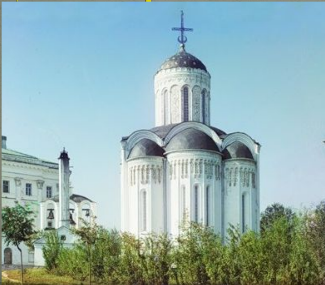
Дмитриевский Собор. Фото 1912г.