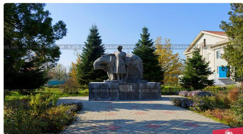
Памятник революционным казахам, станция Гиагинская