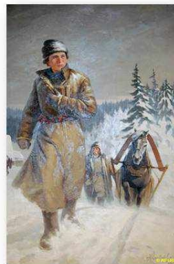
Михаил Васильевич Ломоносов