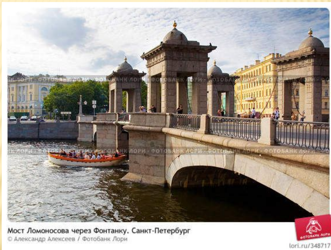
Мост Ломоносова через Фонтанку. Санкт-Петербург