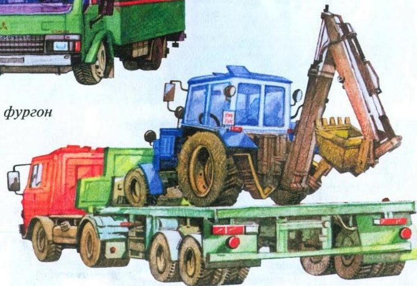
платформа с экскаватором