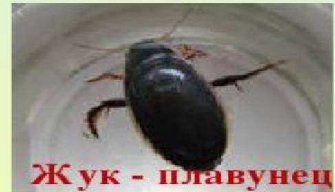
Жук - плавунец