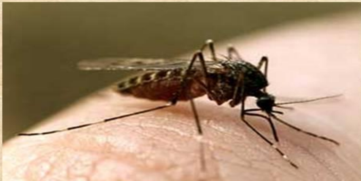
Комар-пискун или обыкновенный

Взрослые кровососущие комары - стройные двукрылые с вытянутым телом, имеют скромную сероватую или рыжеватую окраску, длинные тонкие ноги и игловидный колющий хоботок. Кровь сосут самки, самцы питаются нектаром цветов. Массовым видом является комар-пискун или обыкновенный. Его легко можно отличить от других комаров: когда он садится на что-нибудь, то держит брюшко параллельно поверхности или немного опускает. На фото - насосавшаяся самка.