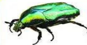
ЖУК ЗОЛОТИСТАЯ БРОНЗОВКА