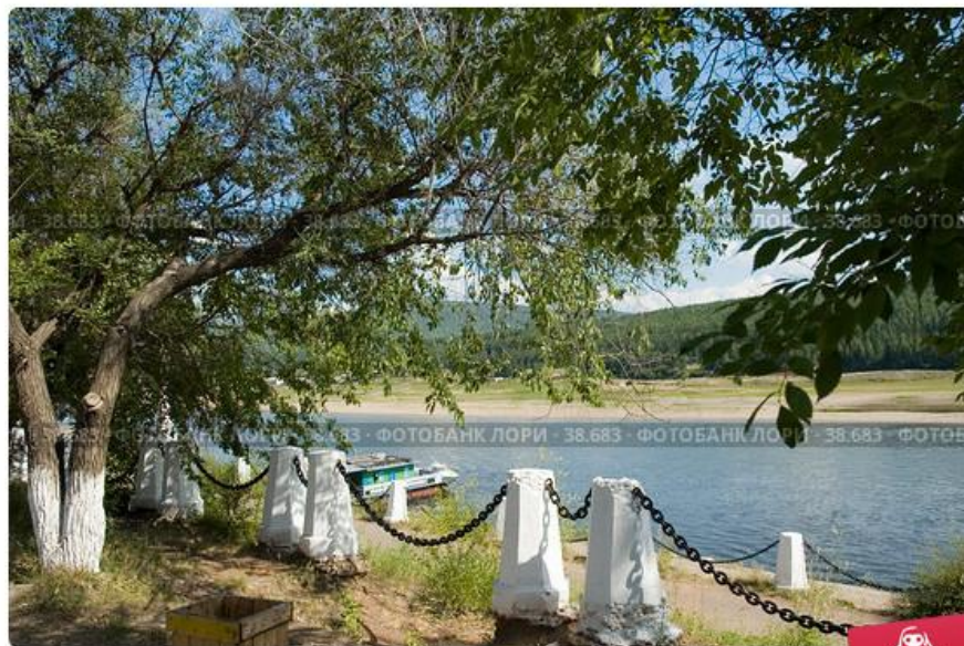
Набережная реки Лены в городе Усть-Куте

Здесь леса - и вблизи,и вдали, С древесиною разных пород. Но щедрее сибирской земли - Богатырский усть-кутский народ.