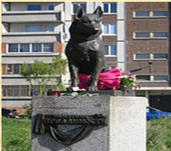
Памятник Преданности, Тольятти, Россия

В благодарность за свою преданность и безупречную службу собаке во многих странах установлены памятники.