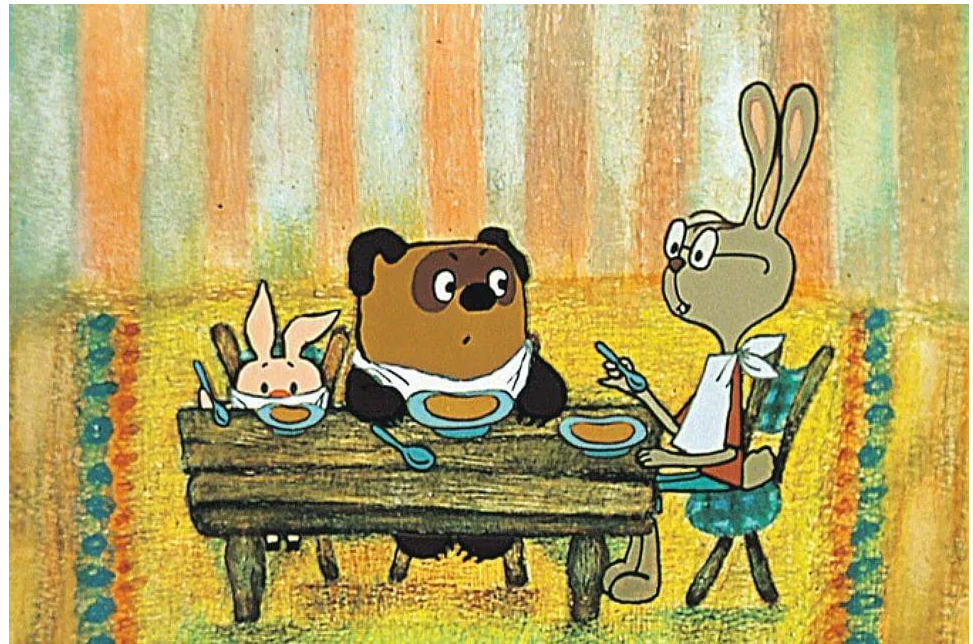
Винни-Пух в гостях у Кролика.