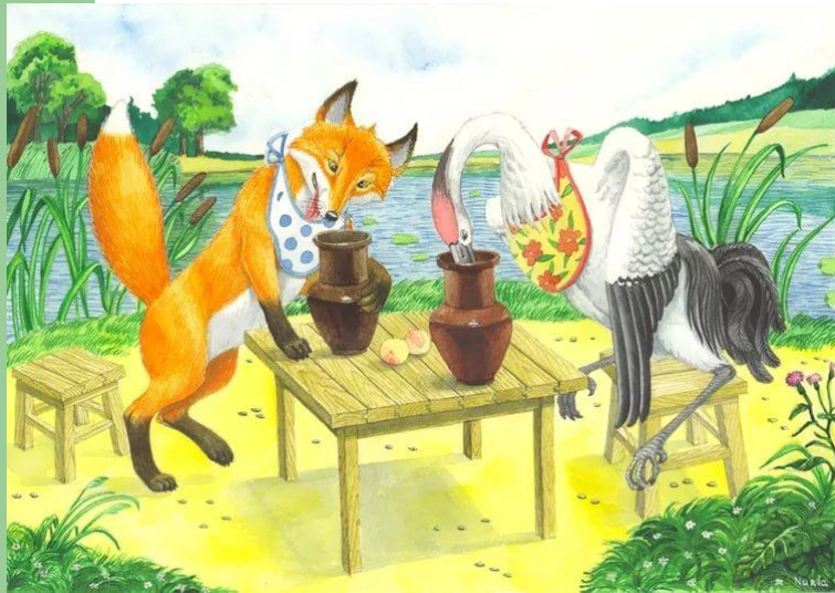
Лиса и журавль.