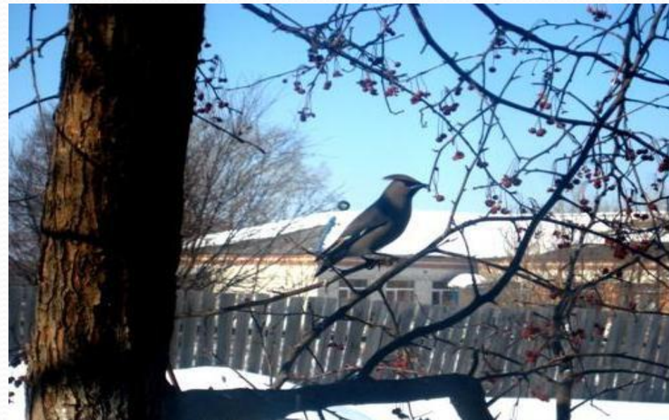
Перламутровка пафия, жук олень, свиристель, дятел.