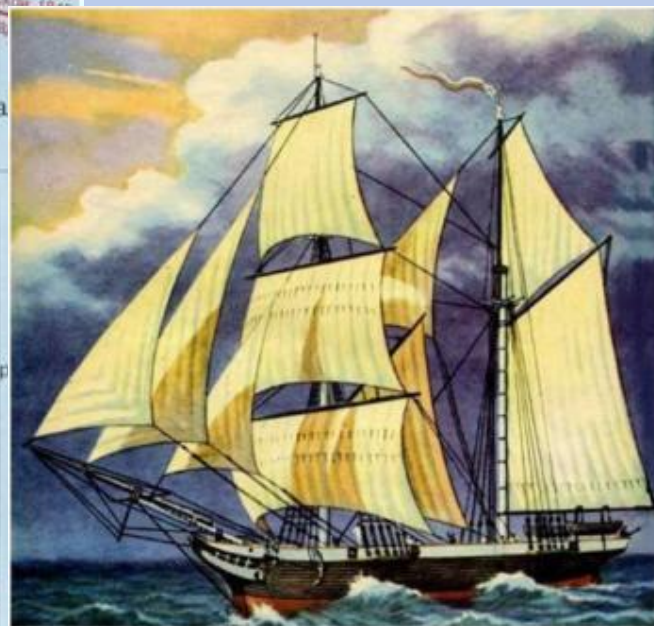
Парусное судно «Байкал»