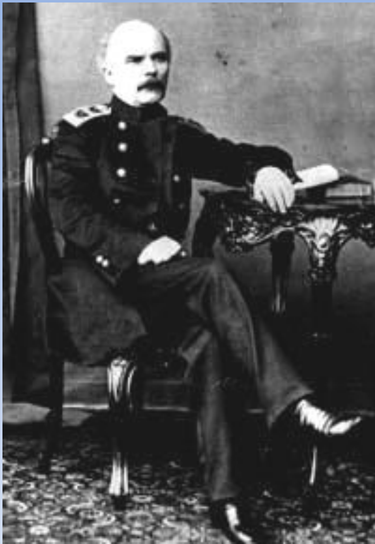
Г. И. Невельской