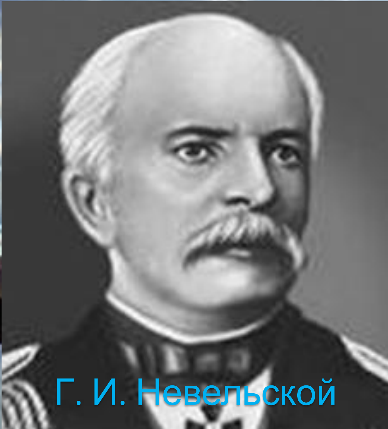
Г. И. Невельской