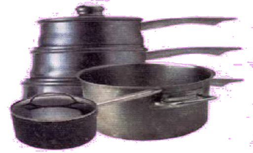
НАБОР КУХОННОЙ ПОСУДЫ