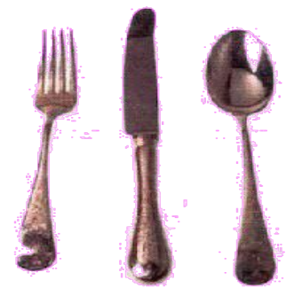
ВИЛКА, НОЖ, ЛОЖКА