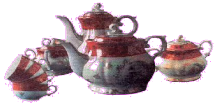
НАБОР ЧАЙНОЙ ПОСУДЫ

Где бы вы применяли эти предметы? Где бы вы могли бы их использовать? Дайте свои ответы.