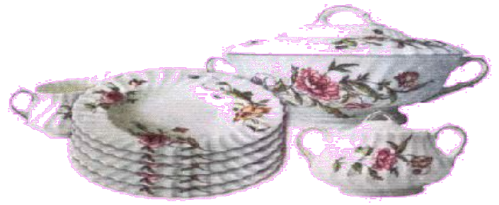
НАБОР СТОЛОВОЙ ПОСУДЫ