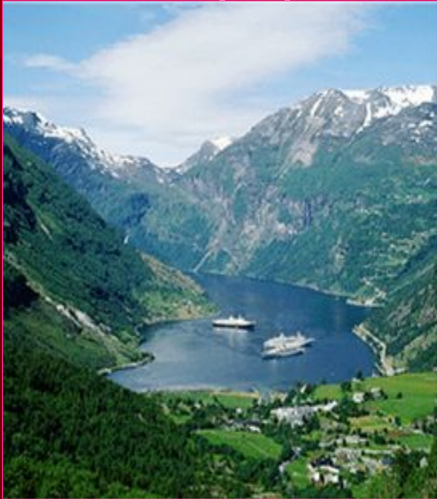
Заливы с крутыми скалистыми берегами - фьорды