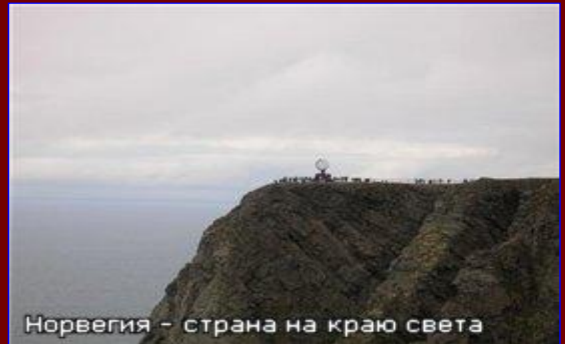
Норвегия - страна на краю света