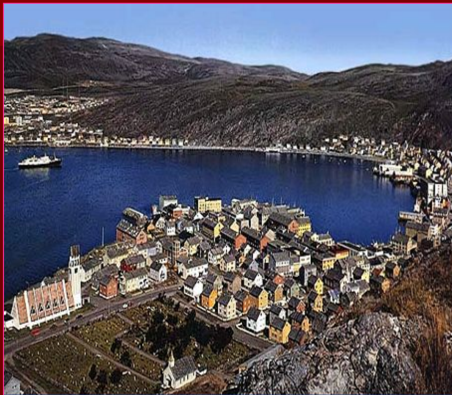
Город Тронхейм. Панорама.