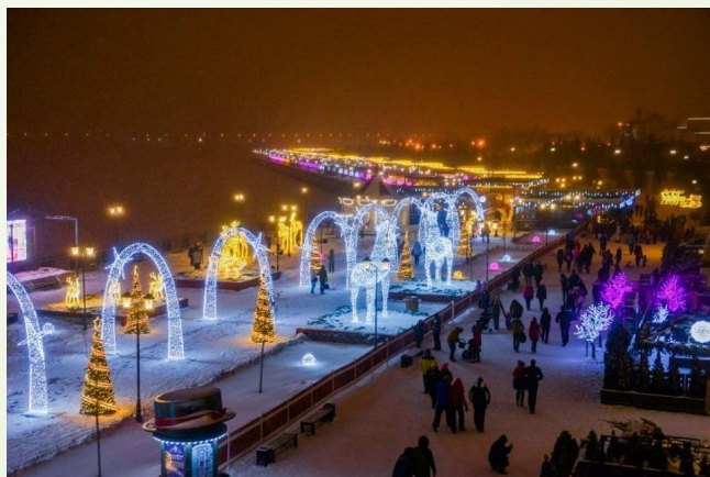
□ Набережная на Волге