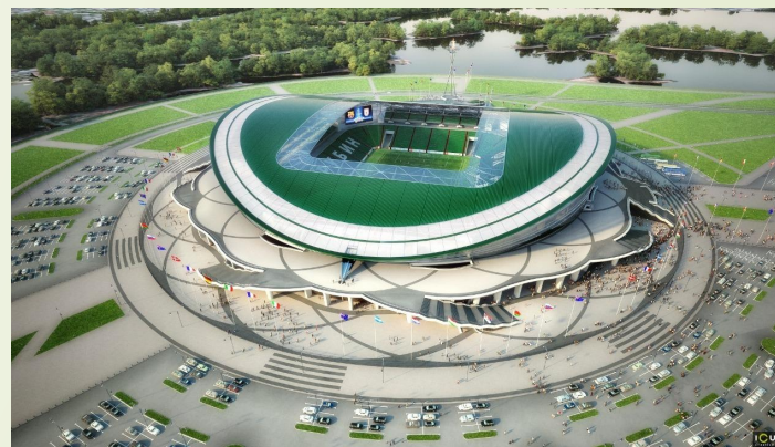
□ Набережная на Волге