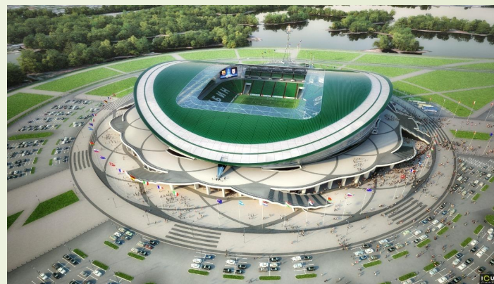
Казань Арена – спорт комплекс