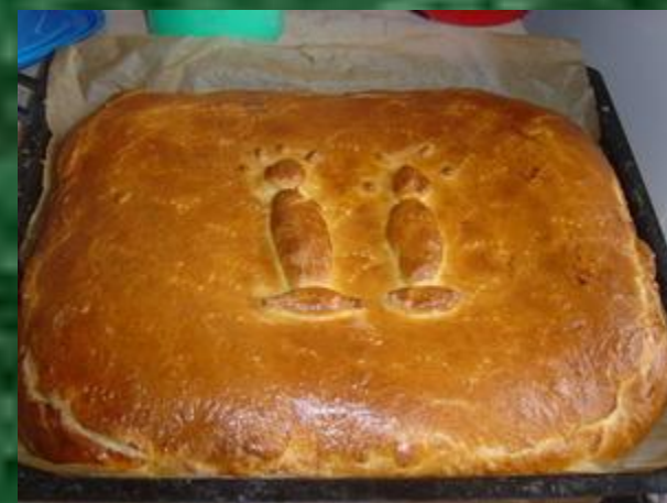
Рис едят отварным, из него варят каши и делают запеканки, рис добавляют в супы, салаты, используют как начинку для пирогов, готовят из риса плов с овощами и бараниной.