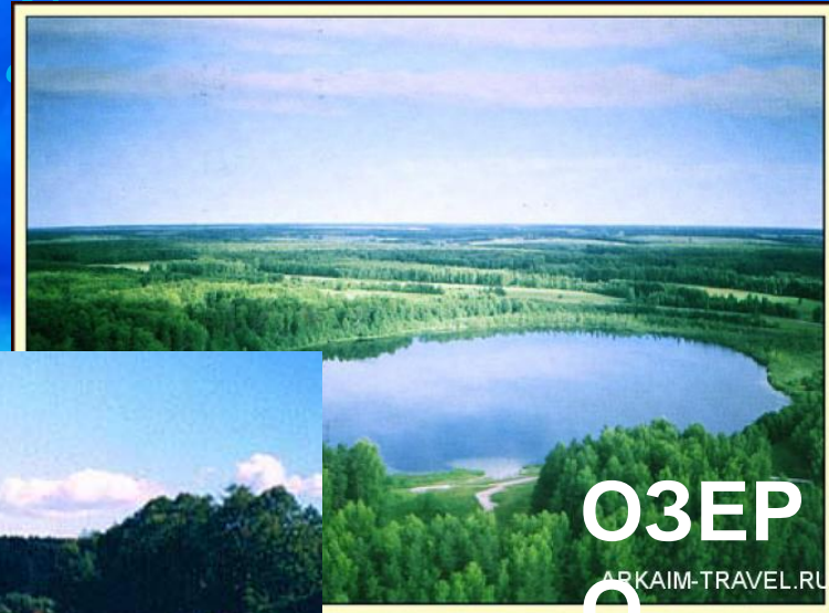
ОЗЕР ARKAIM-TRAVEL.RU О