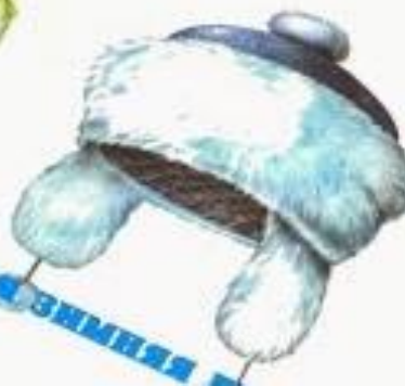
Дамская зимняя шапка