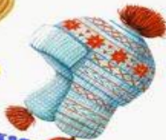
Детская вязаная шапка