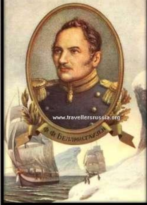
Фаддей Фаддеевич Беллинсгаузен