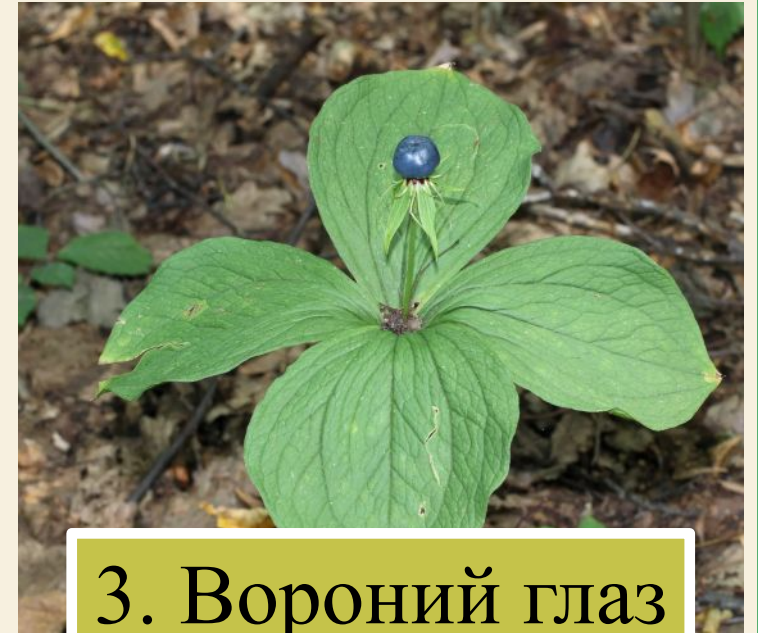
3. Вороний глаз