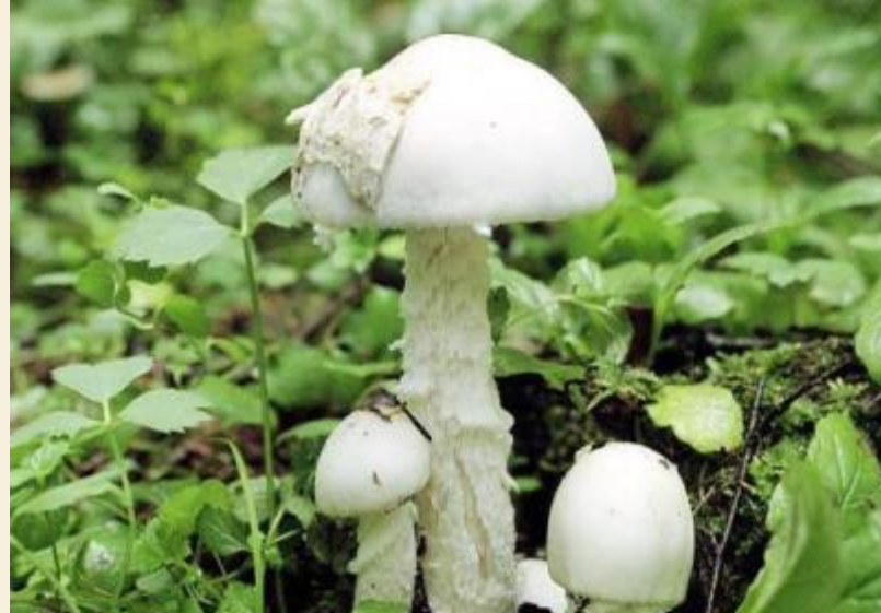
2. Мухомор вонючий