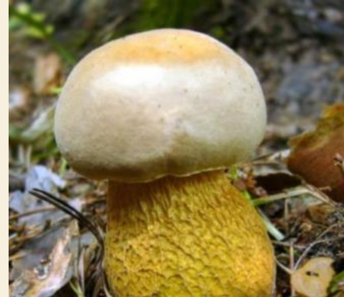
3. Жёлчный гриб