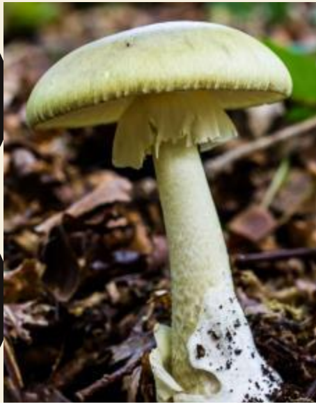
1. Бледная поганка