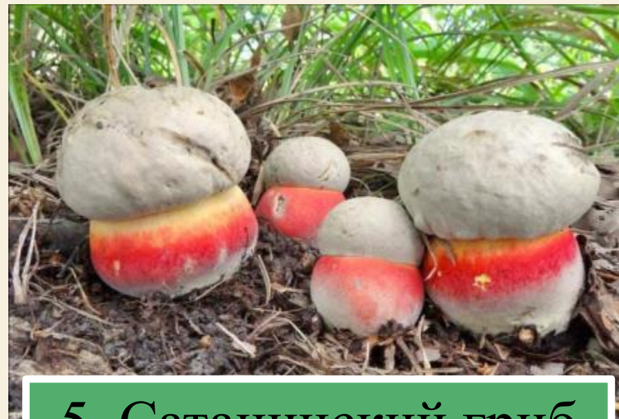
5. Сатанинский гриб