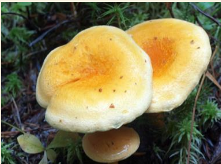
4. Ложные лисички