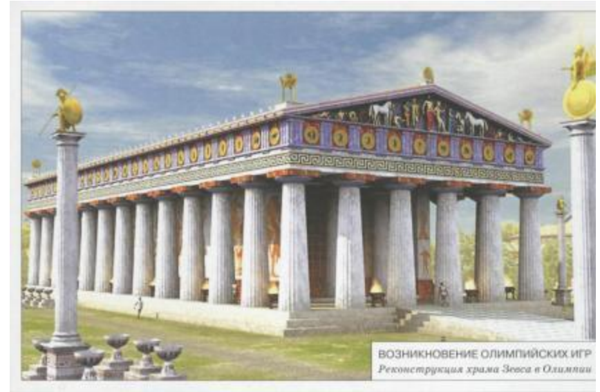
ВОЗНИКНОВЕНИЕ ОЛИМПИЙСКИХ ИГР Реконструкция храма Зевса в Олимпии

Олимпийские игры проводились в священном округе Зевса в Олимпии. Их организовывали раз в четыре года. Каждые Олимпийские игры превращались в праздник для народа, на это время прекращались все войны. В Олимпию пребывали атлеты из разных городов, зрители, торговцы.