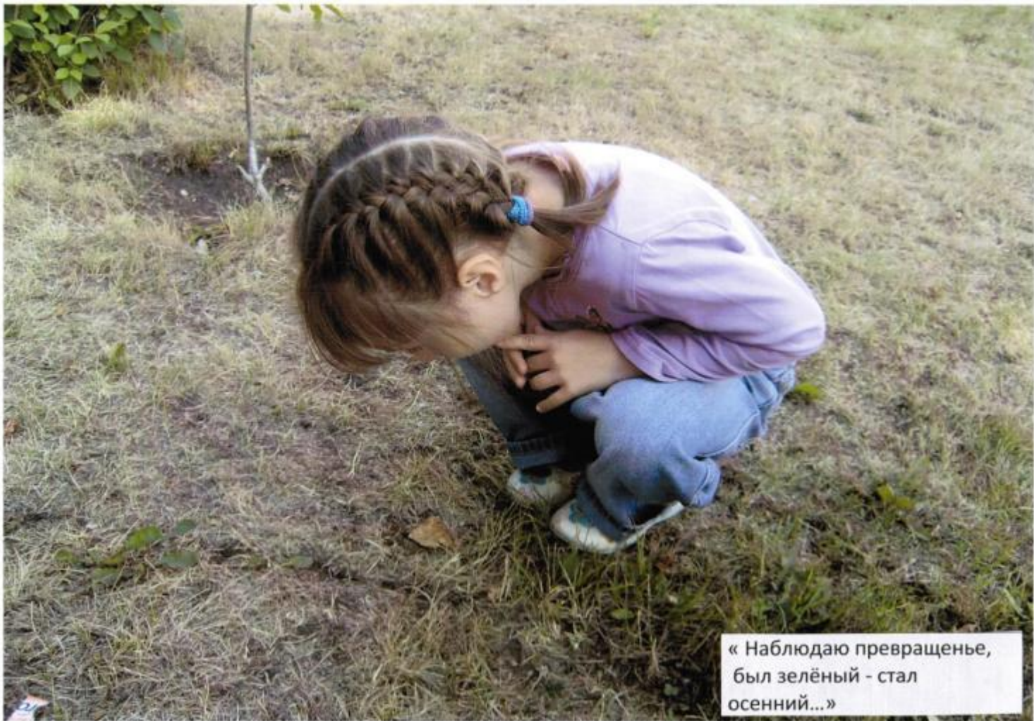
« Наблюдаю превращенье, был зелёный - стал осенний...»