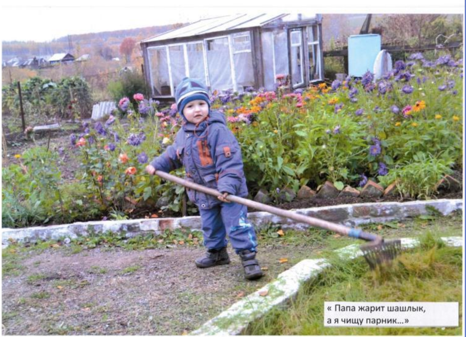
« Папа жарит шашлык, а я чищу парник...»