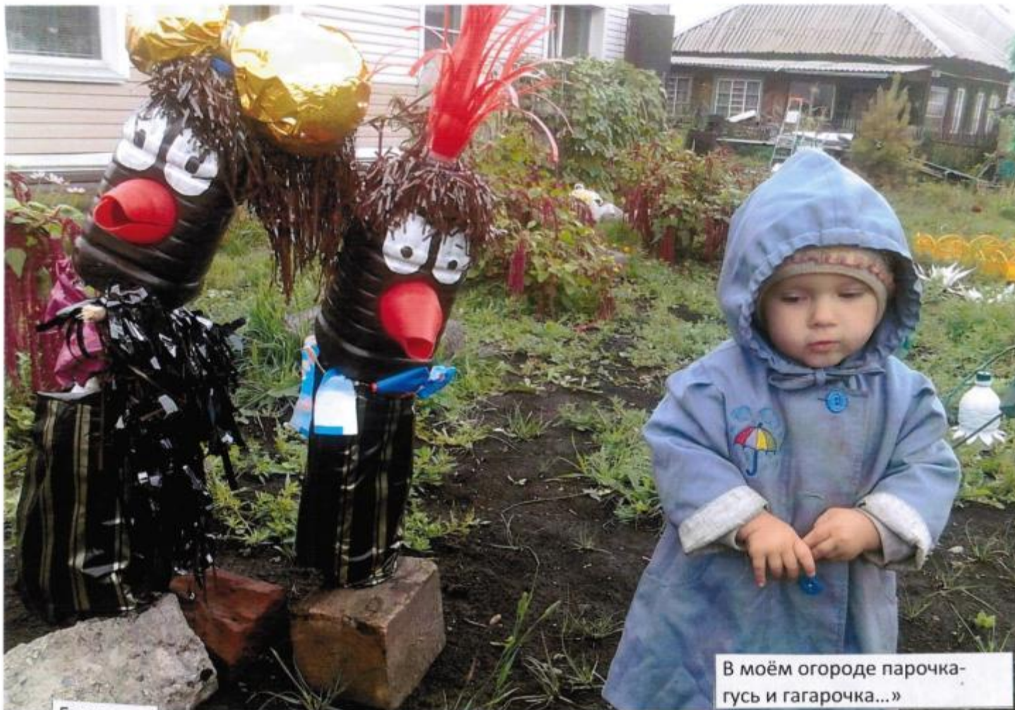
В моём огороде парочка-гусь и гагарочка...»