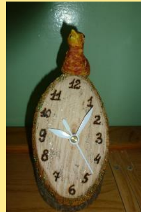
Часы с кукушкой